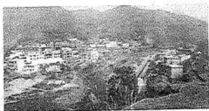
△图为2003年的浙江省下姜村

2. 党的十八大以来,中央深化改革,扎实推进农村环境整治。下图为浙江省下姜村环境整治前后的变化。由此可见,深化改革