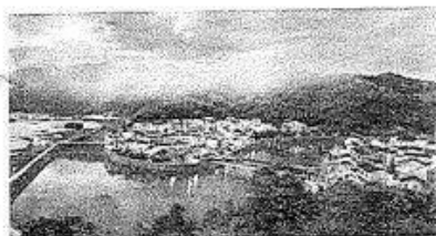
△图为2017年的浙江省下姜村