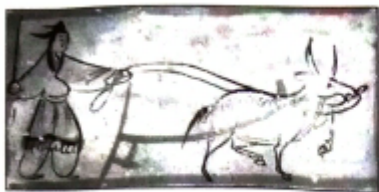
图 1 一牛耕地