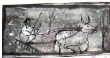
图 2 一牛耙地