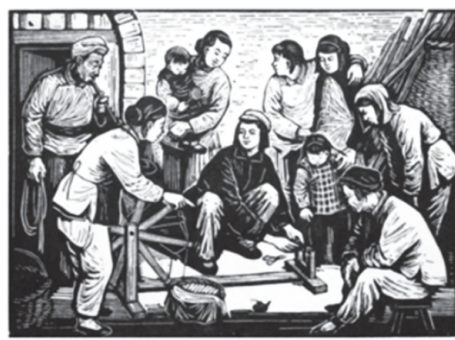
木刻画《给群众修理纺车》, 力群(1945年)

听了毛主席“文艺座谈会”的报告后,延安木刻工作者深入基层,参加各种火热的斗争,年画制作的题材带有浓厚的生活气息……1945年延安的新年画运动总结出了创作经验,内容上强调“尊重民间风习道德”;形式上“又夸张又写实”,适合于广大人民群众(首先是农民群众)欣赏习惯的民间年画的传统风格。 ——摘自陈叔亮《从延安的新年画运动谈起》(1953年)