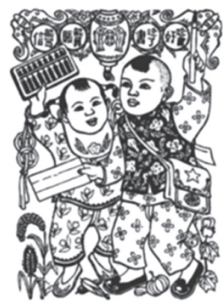
年画《念书好》,江丰(1944年) 画图中文字为“念书好,念了书, 能算账,能写信”