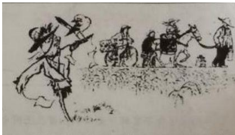
鸟儿对草人说：“我过去一直以为你是农民，现在农民可不像你这个样儿了。”