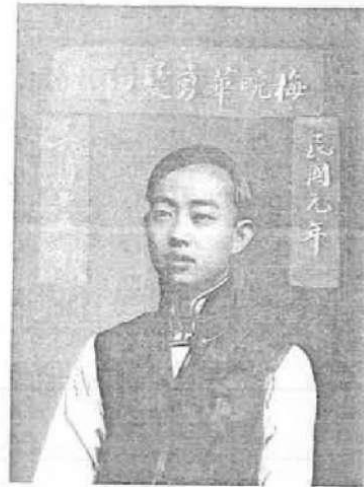
图2 1912年剪发后的梅兰芳