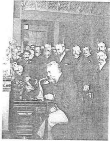
图1 1892年在纽约展示电话机的贝尔