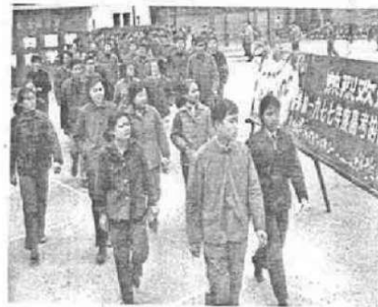
图4 1977年参加高考的考生