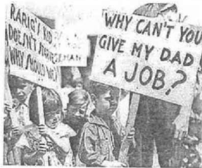
图3 1929年经济大危机中的孩子