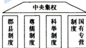
中央集权与四大基本制度

材料 有学者认为,与其他国家相比,中国最独特之处在于,我们是唯一保持了两千年中央集权制度的国家。从本质上来说,中国历史上的众多制度都围绕着四大基本制度展开。这四个基础性制度,如四根“支柱”共同支撑起中央集权的“大厦”,从而维护了中国作为统一多民