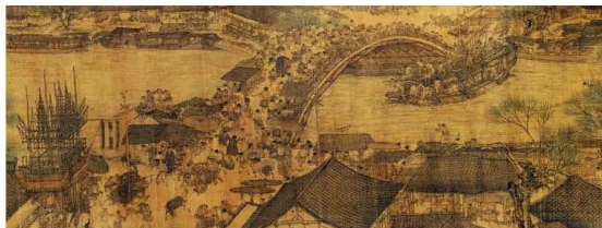
北宋张择端《清明上河图》(局部)