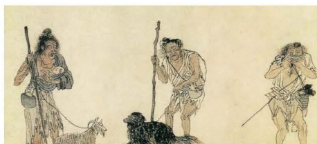
北宋郑侠《流民图》(局部)