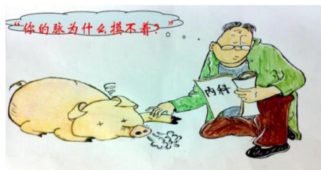
摸不着脉的原因是什么?

16. 下列诗句中蕴含的哲理与漫画《你的脉为什么摸不着?》揭示的哲理相符的是( )