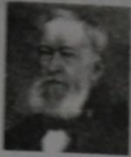
图为阿尔弗雷德·克虏伯(Alfred Krupp),家族企业第二代接班人。他子承父业时还只有14岁。他是一位超凡卓越的领导人,被称为“农炮之王”。

1835年,德意志地区投入营运的铁路里程仅为8公里,1845年为124公里,1856年为8290公里。阿尔弗雷德抓住这一契机,开始生产铸钢的火车轮轴和车轴。1852年,德意志地区第一款无缝铸钢火车轮轴。伴随着普鲁士军队的不断强大,克虏伯公司在1867年的巴黎“万国博览会”中展出长5.1米、重50吨的巨型大炮。19世纪70年代末,克虏伯公司生产的火炮已经列装了46个国家的军队。