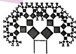
第 14 题图

14. 毕达哥拉斯树是由古希腊数学家毕达哥拉斯根据勾股定理画出来的一个可以无限重复的图形, 因为重复数次后的形状好似一棵树, 所以被称为毕达哥拉斯树, 也叫“勾股树”. 毕达哥拉斯树的生长方式如下: 以边长为 1 的正方形的一边作为斜边, 向外做等腰直角三角形, 再以等腰直角三角形的两直角边为边向外作正方形, 得到 2 个新的小正方形, 实现了一次生长, 再将这两个小正方形各按照上述方式生长, 如此重复下去, 设第 n 次生长得到的小正方形的个数为 a_n , 则数列 \{a_n\} 的前 n 项和 S_n = \underline{\hspace{2cm}} .