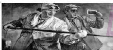
提高生产 保证质量 是热爱祖国的表现