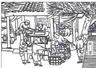
《清明上河图》(临摹,局部)