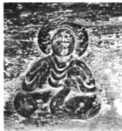
四川彭山东汉崖墓出土的陶质摇钱树座上的佛像 四川乐山麻浩东汉崖墓中的坐佛图

1941年彭山东汉崖墓出土了一件陶质摇钱树座,底部为双龙衔璧图像,身部采用浮雕手法,塑造了“一佛二胁侍”人物造型。在乐山麻浩和柿子湾两座东汉崖墓中后室的门额位置,也发现了三尊坐佛像,皆采用浮雕技法刻成,形象逼真。类似的考古发现还有很多,可知佛教从印度传入四川的时间显然要早于北方。从四川早期佛教造像出土的地点看,主要分布在西南丝绸之路的干道上,而且呈现出向北方和长江中游传播的趋势。