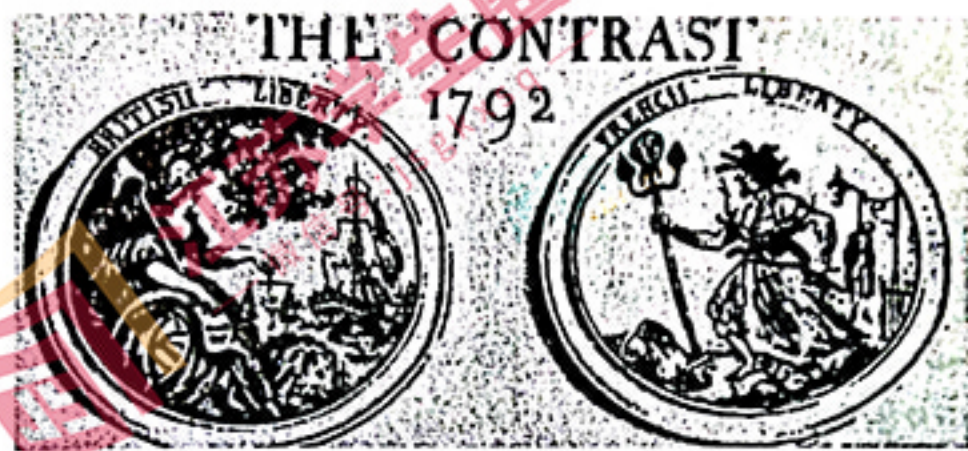
图2 托马斯·罗曼森漫画:对比之下何者为佳?

13. 图2是英国漫画家托马斯·罗曼森创作的一幅讽刺漫画,画面左边“英国自由”代表正义、繁荣和稳定,而右侧的“法国自由”则意味着苦难、不公和毁灭。漫画发表后,英国政府大量复制宣传,其主要意图是