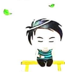
等待的时候,一分钟都变得很漫长