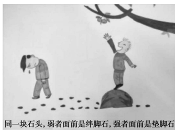
同一块石头,弱者面前是绊脚石,强者面前是垫脚石 “绊脚石”与“垫脚石”