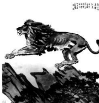
图6 《新生命活跃起来》