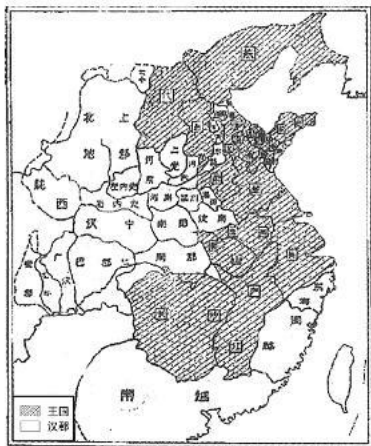
图 1 文帝后期十七诸侯二十四郡