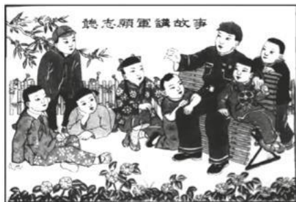
图7 听志愿军讲故事

杨家埠位于山东省潍坊市东北,其木版年画的历史已有600多年。杨家埠版画是我国著名的三大民间年画之一。下面三幅图画是20世纪50年代杨家埠的木版年画。