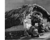
美术电影《神笔》剧照