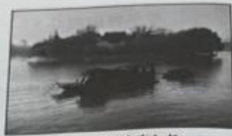
浙江嘉兴南湖红船