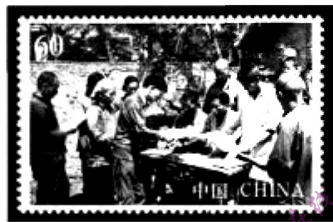
图4 家庭联产承包责任制(1980)