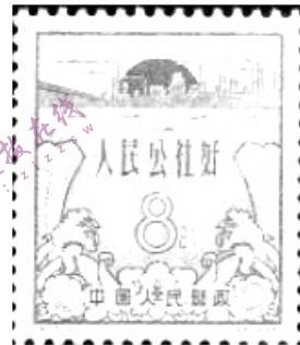
图3 人民公社化运动(1959)