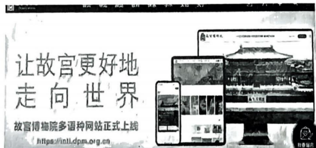
故宫博物院官网截图