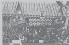
①朝阳区深沟村土地改革工作会