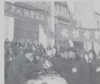
③崇文区手工业者加入生产合作社