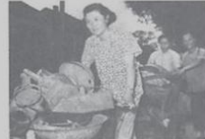
②北京居民参加大炼钢铁运动