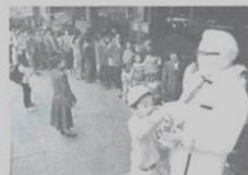
④北京第一家肯德基炸鸡店开业