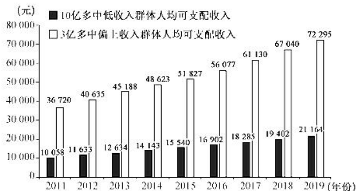
我国两组别居民的收入比较