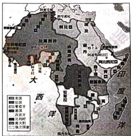
图2 非洲形势图(1884年,柏林会议后)