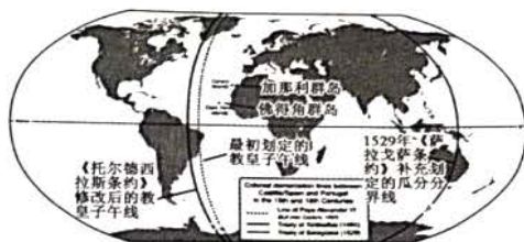
图1 教皇子午线(注:1494年经教皇仲裁,西班牙和葡萄牙在世界上划分势力范围的分界线。)