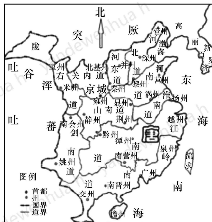
贞观年间十道示意图