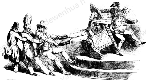
《这群无赖总是制造麻烦》