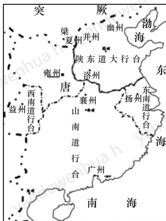
武德年间诸行台示意图