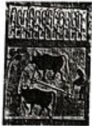
图 2 东汉牛耕画像石