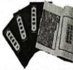
图 3 《齐民要术》