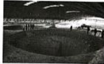
图 4 隋唐含嘉仓遗址

(1) 为研究中国古代粮食安全问题，某学习小组搜集到以上三则史料。请分别说明其史料价值。(6 分)