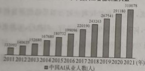
图1 2011—2021年中国人工智能从业人数