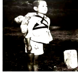
原子弹爆炸后，背着离世弟弟的日本男孩