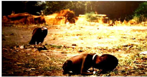
1993年苏丹饥荒中的儿童