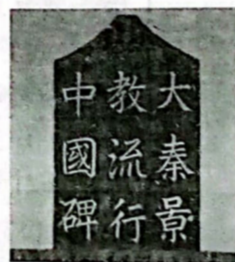
大秦景教流行中国碑（局部） 第18题图