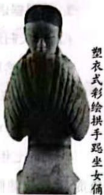
塑衣式彩绘拱手跪坐女俑

【活动四:融通】为促进与中亚各国的友好交往,学校组织开展“‘一带一路·鸿雁传书’——与中亚各国中学生互赠寄语”活动。请引用下面的一个语句,写一段话赠予对方。(2分)