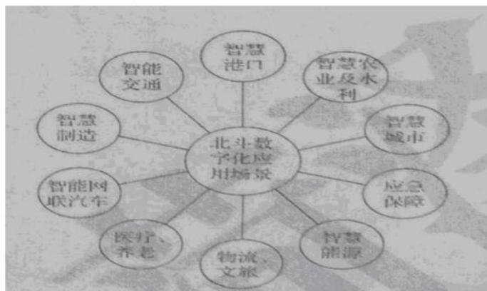
图3 卫星导航与位置服务业态示意图

和“杠杆”效应。但是，这类基础设施建设周期比较长，初期往往存在应用场景不丰富、市场规模小等困难。