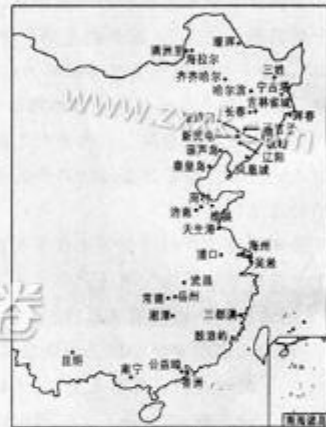
图9 清末自开商埠分布示意图

答：原因：附近杭州、宁波、绍兴等城市经济发达，居民收入高，区域交通便利；(4分) 与周边城市相比，该地附近多低山丘陵，夏季气温相对较低，自然环境较优越，适宜避暑；(3分) 品牌影响不大，难以吸引省外游客。(3分)