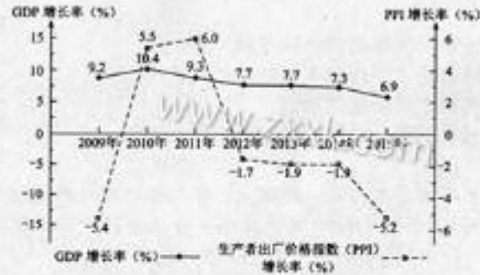
(注: PPI是反映一定时期内全部工业产品出厂价格总水平变动趋势和程度的相对数。)