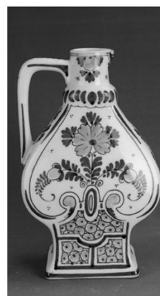
代尔夫特蓝瓷波尔斯酒瓶(反面图)