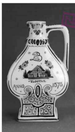
代尔夫特蓝瓷波尔斯酒瓶(正面图)

材料 下图为一件1911年生产的荷兰代尔夫特蓝瓷波尔斯酒瓶,出土于20世纪七八十年代的山东滨州,瓶身标有的“TLOOTSJE”是源于1575年的荷兰酿酒公司的名称,该公司发家的酒类中添加有来自印度的药草和香料,这一酒类持续风靡了400余年。而这件商品在当时是如何流入到当时较为偏远的山东滨州,则存在着多种猜测。