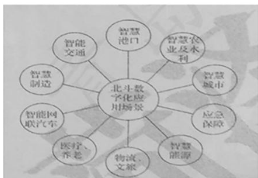
卫星导航与位置服务业态示意图。

材料二 超前布局、超前部署基础性支撑性的重大科技基础设施，将会为更多的创新和应用场景留足孵化期。作为中央前瞻谋划的重大科技基础设施，北斗经过 20 多年的发展，从定位导航授时服务出发。一步步孵化出智能穿戴式设备、高精度时空服务等“北斗+”“+北斗”新业态(如下图)。2021 年我国卫星导航与位置服务产业总体产值约 4700 亿元，凸显了重大科技基础设施的创新“溢出”和“杠杆”效应。但是，这类基础设施建设周期比较长，初期往往存在应用场景不丰富、市场规模小等困难。