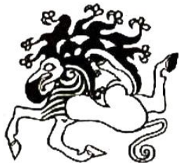
图1 出土于南西伯利亚地区 (前 5-4 世纪)