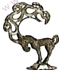
图3 出土于陕西神木 (战国时期)