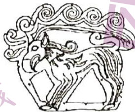
图2 出土于内蒙古鄂尔多斯 (战国时期)