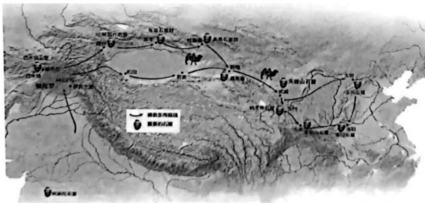
历史试题(湖北卷) 第4页(共6页)