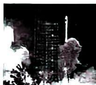
北斗导航卫星发射