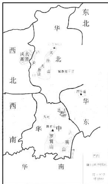
图2 主要中共根据地山河示意图 (1927—1945)