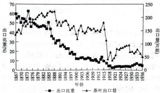
图1 1867~1936年中国茶叶出口量及其在世界茶叶出口总额中的比重