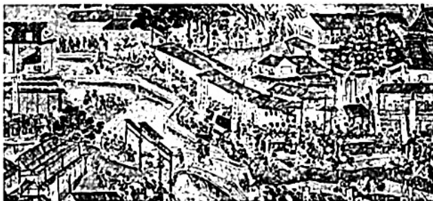
高三历史试卷第1页（共 6 页）

4. 现藏于中国国家博物馆的《南都繁会景物图卷》被称为明代的“清明上河图”（见下图）该画描绘的是南京街市三月庆春游艺活动场面。画卷中的店牌招幌多达 109 个，还绘有“太平有象”“五谷丰登”“吉庆有余”“一统万年”等字样。这表明，该画除了歌颂王朝盛世和城市繁华外，还体现了