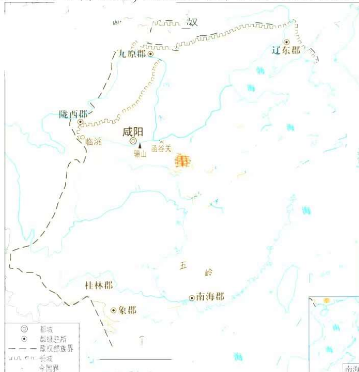
图 3 秦长城（西至甘肃临洮，东临朝鲜半岛）