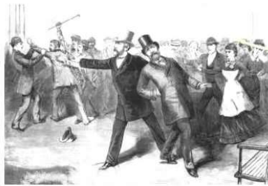
图2 加菲尔德被刺杀