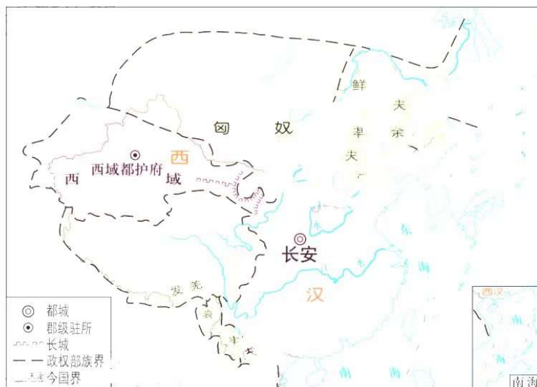
图 4 汉长城（西至甘肃玉门关，东临朝鲜半岛）