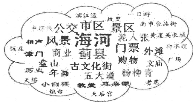
2006年度“天津旅游”词云图

19. 下面是2006年度和2016年度有关“天津旅游”的词云图，是根据国内十大旅游网站筛选出的高频词汇生成的，字号越大，表示该词出现的频率越高，关注度就越高。