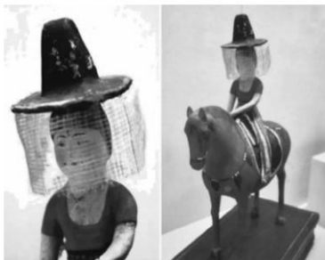
【2024 高三摸底考·历史 第 1 页(共 6 页)】