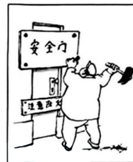
第 18 题图

19. 类囊体是植物光合作用至关重要的“基地”，植物的“能量密码”就蕴藏其中。中国科学家团队从菠菜中提取了类囊体，并借助细胞膜纳米涂层技术，在国际上首次实现将类囊体跨物种移入动物体衰老退变的细胞内，让动物细胞可以分享植物光合作用的能量，以此扣响逆转细胞退变衰老的“时光之门”。这佐证了