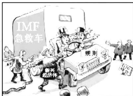
图2 IMF的前进方向在哪里？

16. 欧盟统计局发布的数据显示，2020年中国首次超越美国成为欧盟最大贸易伙伴。中国是世界上最大的发展中国家和新兴经济体，欧盟是最大的发达国家集团，双方经贸的紧密合作、蓬勃发展，将极大促进疫情冲击下的世界经济的复苏与增长。材料说明