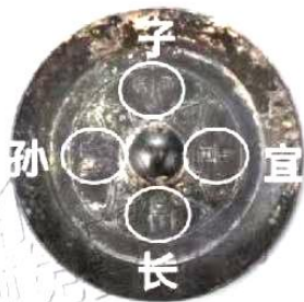
图1 广西贵港出土汉代铜镜