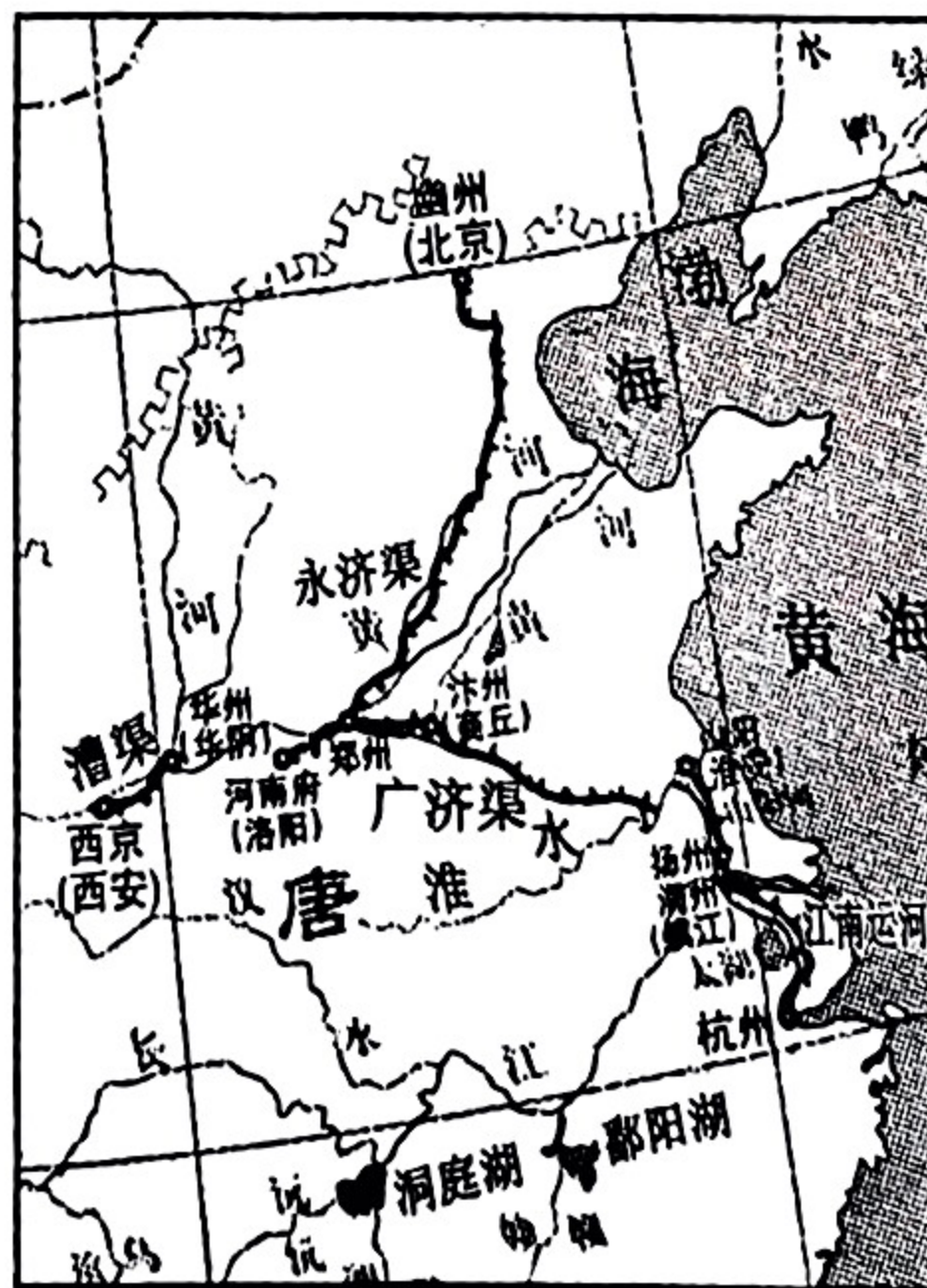
图2 隋唐时期的运河