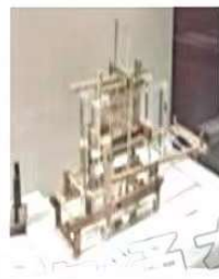
④老官山墓提花机模型