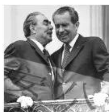
1972年，在访美期间，勃列日涅夫与时任美国总统的尼克松“亲切交谈”