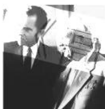
1959年，时任美国副总统的尼克松访问苏联期间与赫鲁晓夫展开“厨房辩论”