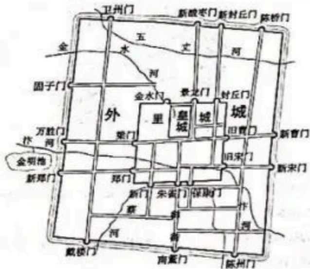
图2 北宋东京城商业区示意图