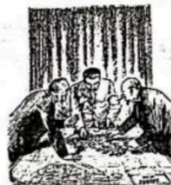
图4 《碎片的麻烦》(1945年2月7日)

材料 雅尔塔会议结束前后, 产生了许多以此为题材的漫画作品, 以下是其中比较有代表性的两幅漫画。