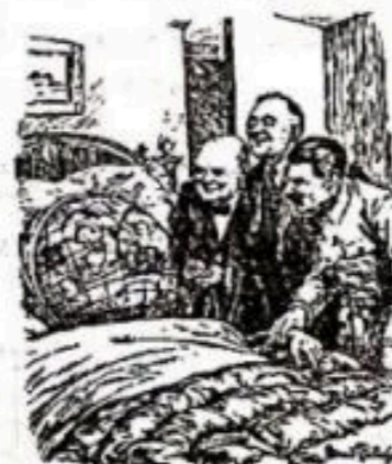
图5 《今天感觉好些了吗?》(1945年2月21日)

注: 罗斯福、斯大林和丘吉尔站在铺有欧洲地图的桌前, 就德国东部与波兰等东欧地区的版图正在进行一场拼图游戏。