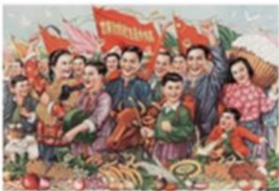
走农业合作化道路